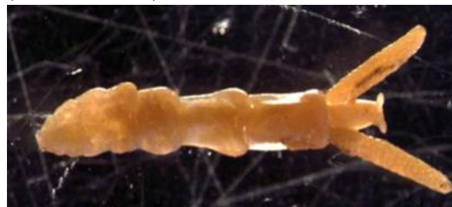
Figuur 4: De parasiet Mytilicola intestinalis . De twee uitsteeksels aan de rechterzijde zijn ei pakketten (grootte 9 mm).

Het is bekend dat parasieten en ziektes door virussen en bacteriën ook kunnen leiden tot grote sterfte onder schelpdieren. Vibrio 's spelen mogelijk een rol bij de zomersterfte onder juveniele oesters in Frankrijk. Ook leidt het oesterherpesvirus (Ostreid herpesvirus 1; OshV-1) tot grote sterfte onder Japanse oesters. OshV-1 is ook infectieus voor platte oesters en een aantal andere schelpdieren. Er zijn geen aanwijzingen dat de mossel gevoelig is voor OshV-1. (Kamermans e.a., 2013). Een bekende eencellige parasiet bij platte oesters is Bonamia ostreae . Deze exoot, die in 1980 in de Oosterschelde is geïntroduceerd heeft geleid tot grote sterfte onder platte oesters. In tegenstelling tot de meeste andere schelpdieren zijn er in het algemeen maar weinig ziekteverwekkers beschreven die een grote impact kunnen hebben op de mosselpopulatie (Haenen e.a., 2011).