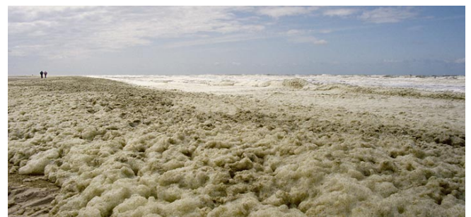
Figuur 2: Schuim op het strand als gevolg van een bloei van Phaeocystis .