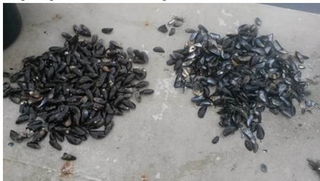
Figuur 5: Sterfte op een perceel in de Oosterschelde in november 2014. Links de levende mosselen (58%) en rechts de peulen (42%).

Als er mosselsterfte optreedt op een perceel kan dit worden gemeld bij de vakdeskundige visserij van het ministerie van EZ. De sterfte in een bestand wordt berekend aan de hand van het aantal "verse peulen", lege schelpen zonder aangroei aan de binnenkant (Figuur 5). Als de sterfte in korte tijd meer dan 15% bedraagt spreekt men van een abnormale of verhoogde sterfte. Als er een verhoogde sterfte wordt waargenomen, zonder dat er een direct verband gelegd kan worden met omgevingsfactoren (zuurstofloosheid, lage zoutgehalten, etc.), wordt er een onderzoek gestart om betrokkenheid van ziekteverwekkers uit te sluiten dan wel aan te tonen. De sterfte worden dan aangemeld bij de NVWA. De NVWA kan dan een bemonstering laten uitvoeren door de vakdeskundige visserij van het ministerie van Economische Zaken die zal worden opgestuurd naar het Centraal Veterinair Instituut (CVI). Als er verdenkingen zijn op andere oorzaken kunnen er ook nog schelpdiermonsters worden genomen die door IMARES worden onderzocht op algemene conditie (parameters als vleespercentage, gonaden, filtratiesnelheid) of kunnen er omgevingsvariabelen worden gemeten.