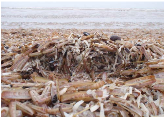
Figuur 1: Massaal angespoelde mesheften op het strand bij Katwijk

Massale sterfte van schelpdieren is niet bijzonder. Van mesheften is bekend dat deze massaal kunnen aanspoelen langs de Nederlandse stranden (Figuur 1). Deze schelpdieren zitten vaak in zeer dichte banken voor de Nederlandse kust. Het is niet helemaal duidelijk wat de massale sterfte van deze mesheften veroorzaakt maar lijkt een combinatie van zuurstofloosheid na een algenbloei en een verminderde conditie na paaien Cadée (2001).